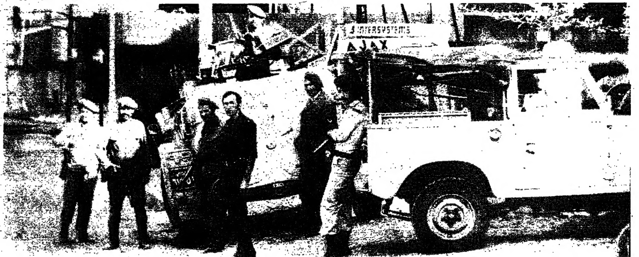
■ قرة من رجال الأمن معسززة بمسحقة قرب الناصرة ■

كسب الرئيس كرامي أمس الرهان على الأمن بنسبة كبيرة ، فتجاوب معه المواطنون في الخروج من منازلهم والتجول في الشوارع رغم أن بعض هذه الشوارع لم يخل من وجود مسلحين ومخترين . والرغبة في التغلب على المخنة لدى معظم المواطنين جعلت بعض الطرقات ، التي لم تكن آمنة رغم الانتعاش ، آمنة وسالكة . ذلك أنه على الرغم من وجود مسلحين عند بداخل الطرقات في أماكن الاشتباكات ، فإن حركة السير الناشط لم تتأثر . وعلى الرغم من بعض الطلقات النارية ، فإن المواطنين لم يهربوا من الشوارع . وزاد في الاطمئنان وجود دوريات من الجيش في المنطقة التجارية ، وإقامة بعض الحواجز في شوارع رئيسية بحثاً عن الأسلحة . ويبقى قلب المنطقة التجارية شبه خال ، بسبب عدم فتح المخلات التجارية ، التي أصيب معظمها أثناء الاشتباكات .